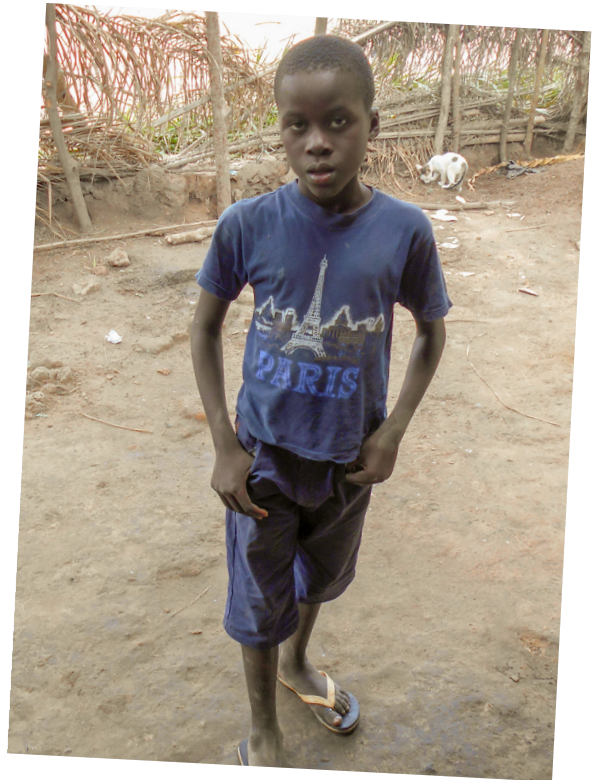
Domingos Na Lana

Kinderen met een beperking hebben het in Guinee-Bissau erg moeilijk. Deze 'onzichtbare' kinderen, nu vaak verborgen in donkere hutten, willen wij naar buiten halen en letterlijk in het licht zetten. Jedidja realiseert de zorg voor deze kinderen en stimuleren hen in de lichamelijke en geestelijke ontwikkeling. Ook ontvangen zij gepaste onderwijs zodra dat mogelijk is. Zo ontvangen dove kinderen onderwijs met behulp van een doventolk.